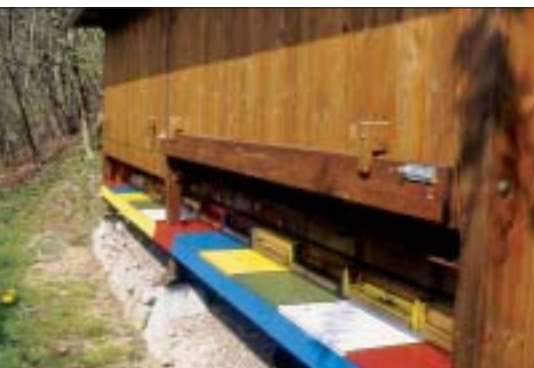
▲ Größeres Bienenhaus mit Trogbeuten. Eine Verglasung an der Frontseite wäre für die Beleuchtung vorteilhaft. Bei wenigen Völkern ist in Wohnungsnähe häufig ausreichend Lagerplatz, und es lassen sich Vorbereitungsarbeiten nebenbei erledigen. ▼