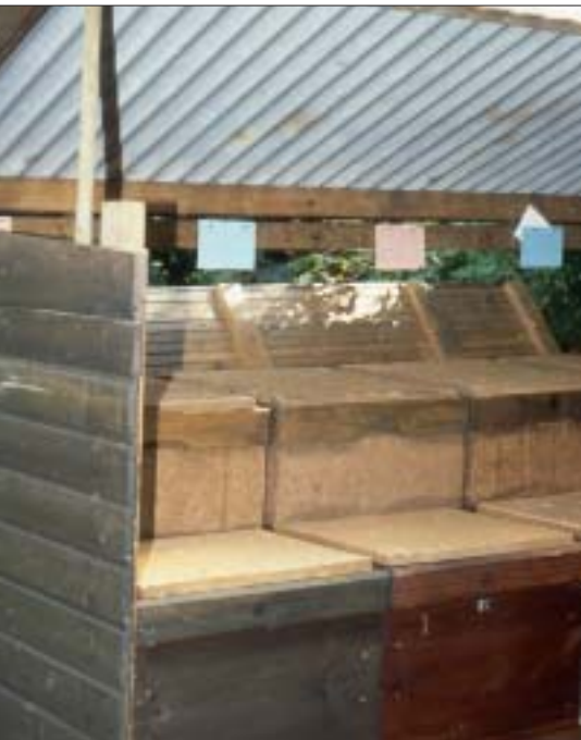
Freiständer sind für Trogbeuten ideal. Durch die Lichtwellenplatten hat man gute Beleuchtungsverhältnisse.