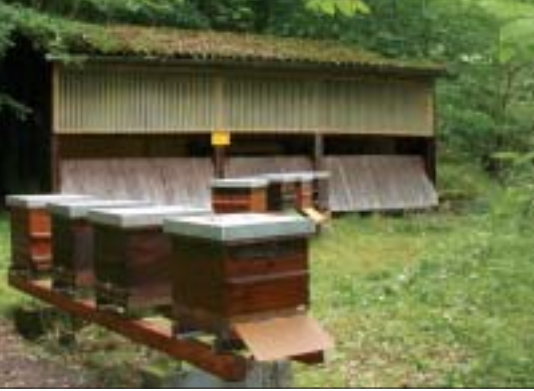
In dem nun leeren Bienenhaus standen früher Trogbeuten. Die Unterbringung der Magazine ist unpraktisch und arbeitsbehindernd, es steht nun leer und muss abgebaut werden.