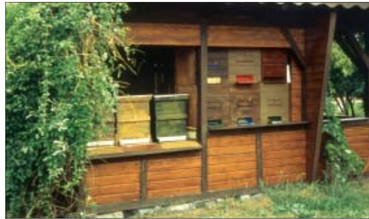
Einfaches Bienenhaus, das mit Kletterpflanzen und Obstgehölzen eingegrünt, gut in die Landschaft eingegliedert ist.

Grundsätzlich will der Gesetzgeber den Außenbereich vollständig schützen, d. h. Veränderungen sind nur in begrenzten Ausnahmefällen möglich (siehe Zitate auf dem Arbeitsblatt). Besonders schützenswert sind Landschafts- und Naturschutzgebiete, dort werden Veränderungen restriktiv eingeschränkt. Auch wenn die Bienenhaltung an sich schützens- und förderungswert ist, ist damit nicht automatisch das Recht verbunden, im Außenbereich, also außerhalb definierter Baugebiete, ortsfeste Anlagen (Bienenhäuser, aber auch Zäune) zu errichten. Bienenvölker selbst, also frei aufgestellte Bienenkästen, dürfen genehmigungsfrei aufgestellt werden. Auch mit Beutenlager für Hinterbehandlungskästen und Trogbauten wird in ähnlicher Weise verfahren. Freiständer (also nicht begehbare Schutzhütten) stellen zwar bauliche Einrichtungen dar, werden aber meistens ebenfalls ohne Genehmigung geduldet.